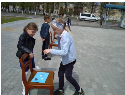
Фото 4.«Конкурс «Дедушка на рыбалке»