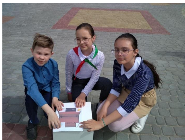
Фото 2. «Конкурс «Кем работает папа?»