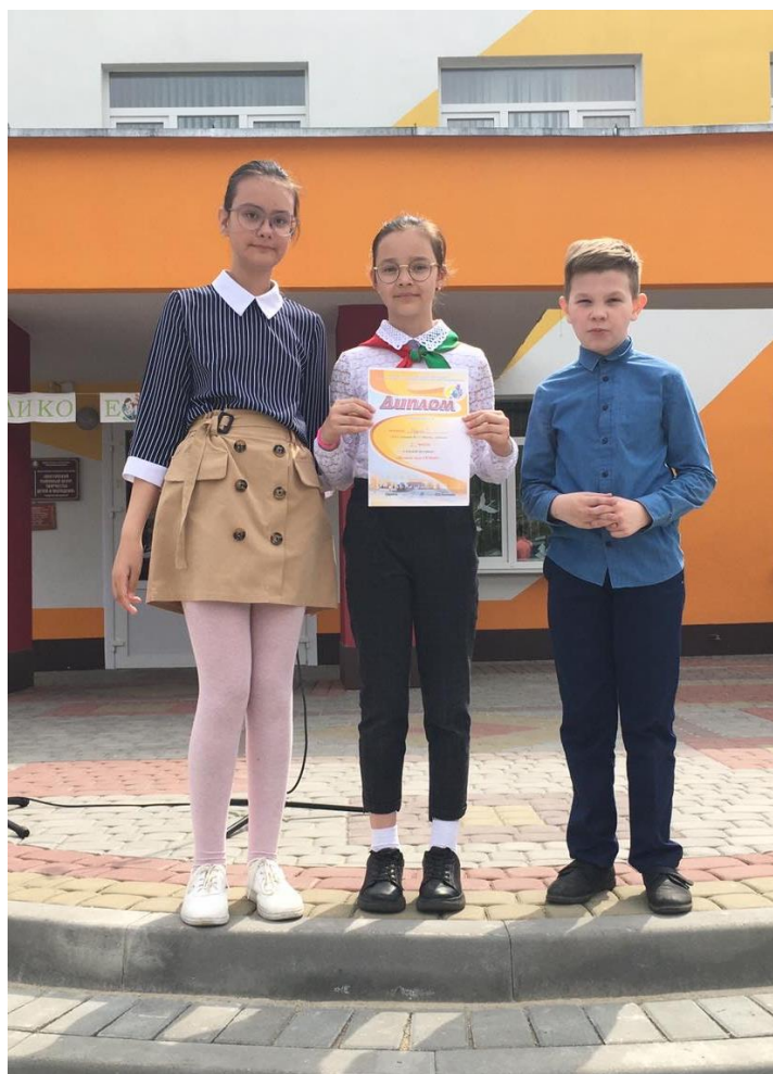
Фото 6. «Награждение победителей»