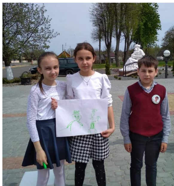
Фото 5.«Конкурс плакатов»