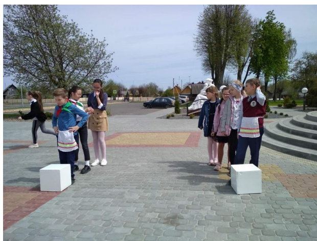
Фото 1.«Конкурс «Мамины помощники»